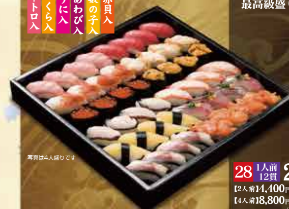
写真は4人盛りです