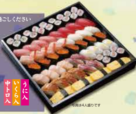
写真は4人盛りです

9 1人前 11貫本 1,420円 【2人前12,840円】【3人前14,260円】 【4人前15,680円】【5人前17,100円】 (上記いずれも+消費税)