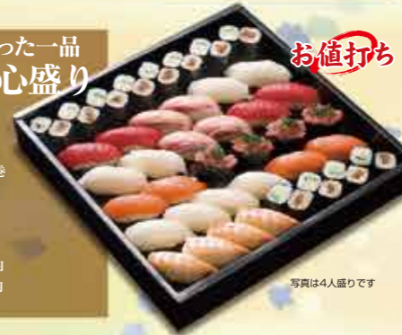
写真は4人盛りです

1 1人前 7貫本 750円 【2人前11,500円】【3人前12,250円】 【4人前13,000円】【5人前13,750円】 (上記いずれも+消費税)