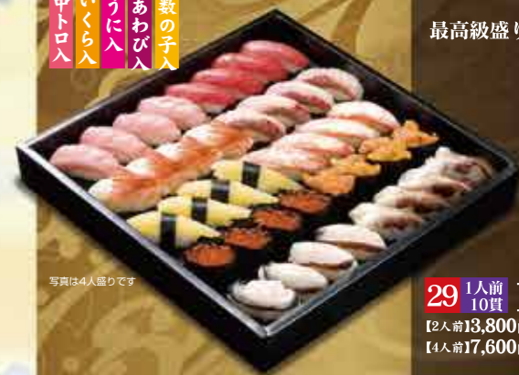
写真は4人盛りです