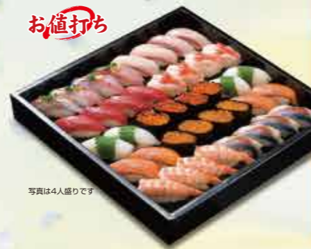
写真は4人盛りです