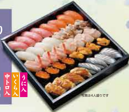
写真は4人盛りです

5 1人前 10貫 1,220円 【2人前12,440円】【3人前13,660円】 【4人前14,880円】【5人前16,100円】 (上記いずれも+消費税)