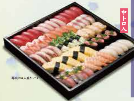
写真は4人盛りです

25 1人前 12貫 1,600円 【2人前13,200円】【3人前14,800円】 【4人前16,400円】【5人前18,000円】 (上記いずれも+消費税)