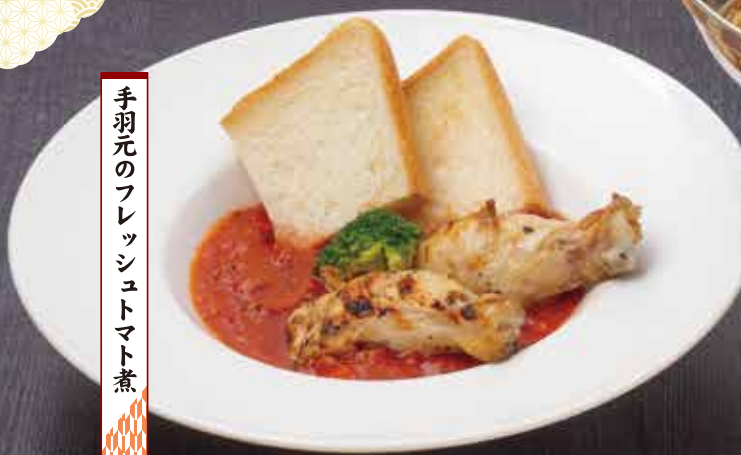
手羽元のフレッシュトマト煮