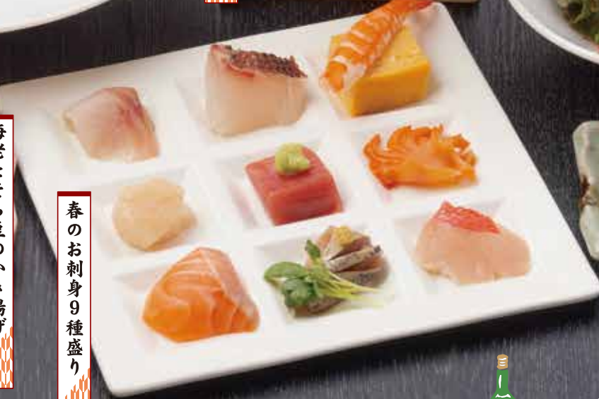
春のお刺身9種盛り