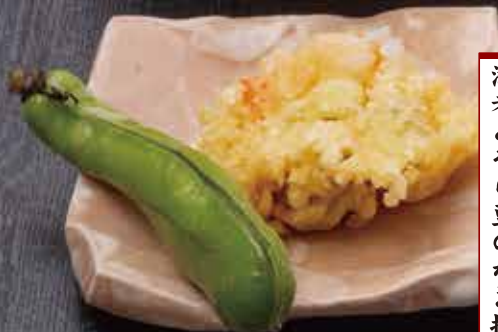
海老とそら豆のかき揚げ