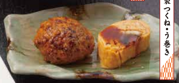
自家製つくね・う巻き