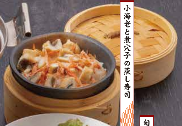
小海老と煮穴子の蒸し寿司