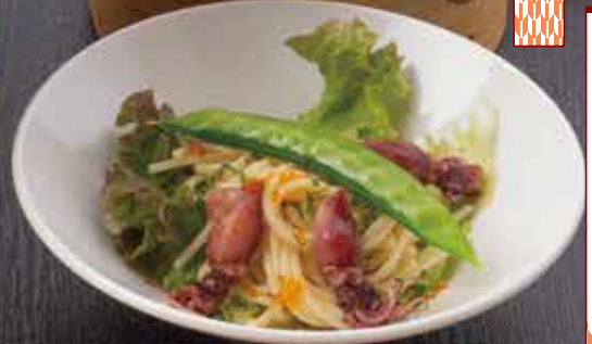
旬の海鮮パスタサラダ