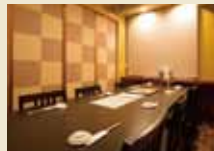
お座敷椅子席(8名様用)