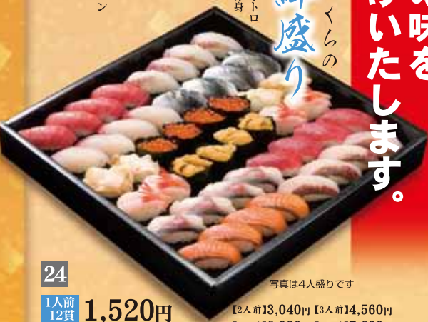
写真は4人盛りです