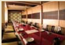
お座敷(大人数様用)