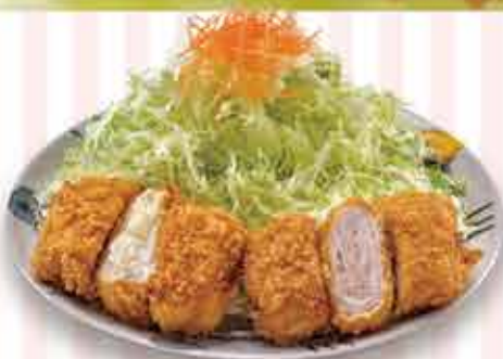
プレーンミルフィーユと お好きなミルフィーユ定食 1,580円 (税込1,738円) 茶碗蒸し付 +110円(税込)