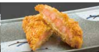
サクッと揚げました 海老かつ 1コ 250円 (税込275円)