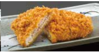
熟成ローズかつ 【ハーフ】 1コ 350円 (税込385円)