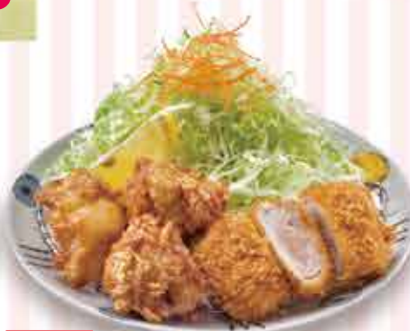
お好きな ミルフィーユと 鶏唐揚げ定食 1,480円 (税込1,628円) 茶碗蒸し付 +110円(税込)