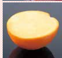
オレンジ 480円 (税込528円)