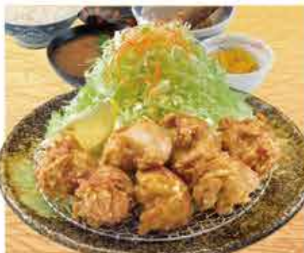
鶏唐揚げ定食 1,080円 (税込1,188円) 茶碗蒸し付+110円(税込)