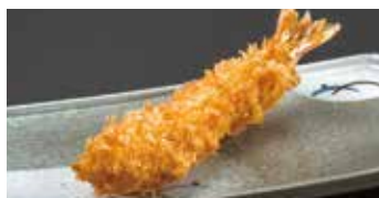
プリプリ! 海老フライ 1コ 270円 (税込297円)