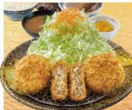
メンチかつ定食 1,180円 (税込1,298円) 茶碗蒸し付+110円(税込)