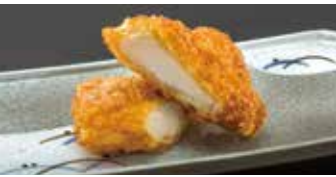
さくさく! いかフライ 1コ 190円 (税込209円)