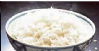
ご飯(白飯・炊き込みご飯・十穀米) 単品 200円 (税込220円)