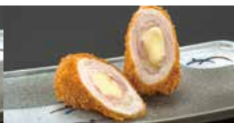
まろやかな風味 チーズチキン 1コ 220円 (税込242円)