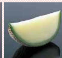
メロン 680円 (税込748円)