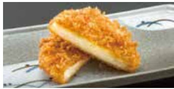
かにクリーム コロッケ 1コ 220円 (税込242円)