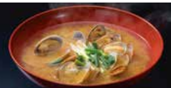
ヘルシー あさり汁 定食ご注文の方 200円 (税込220円) 単品ご注文の方 300円 (税込330円)