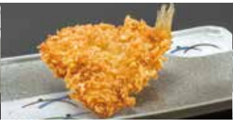
ふんわり キヌフライ 1コ 170円 (税込187円)