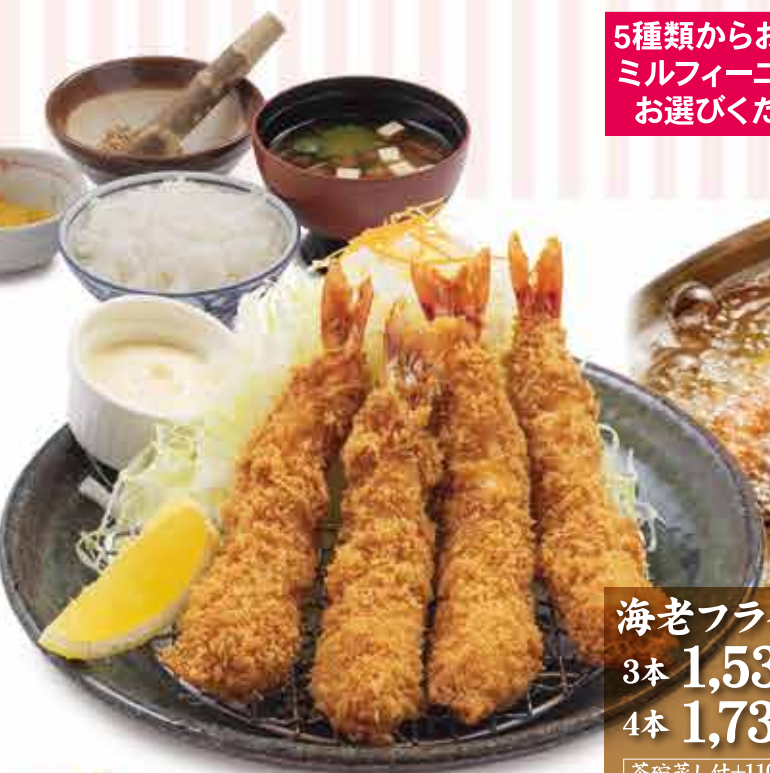
海老フライ盛り定食 3本 1,530円 (税込1,683円) 4本 1,730円 (税込1,903円) 茶碗蒸し付+110円(税込)