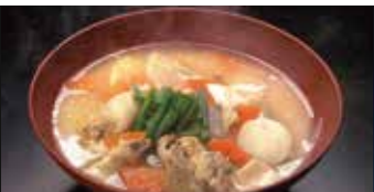
具だくさん豚汁 定食ご注文の方 100円 (税込110円) 単品ご注文の方 200円 (税込220円)