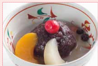
あんみつ 390円 (税込429円)