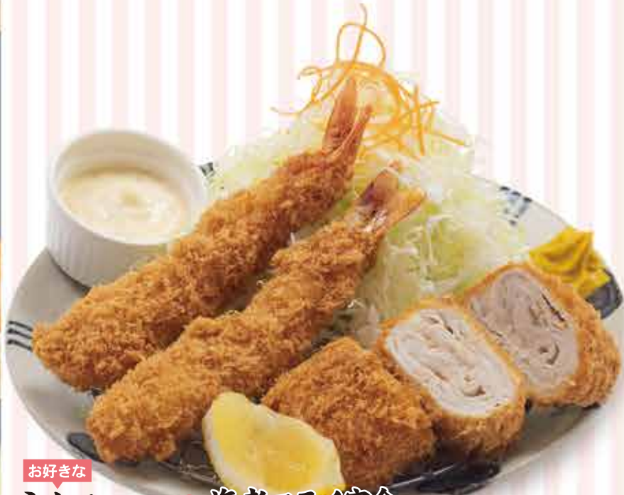
お好きな ミルフィーユと海老フライ定食 1,630円 (税込1,793円) 茶碗蒸し付 +110円(税込)

お好きなミルフィーユをお選びください。 上質の薄切り豚ロース肉を幾重にもかさね とんかつ職人が新しい味わいのとんかつを作り上げました。