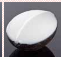
ココナッツ 560円 (税込616円)