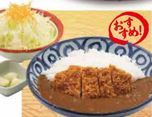
おすす 熟成ロースかつカレー キャベツ、 らっきょう付 1,430円 (税込1,573円) 茶碗蒸し付+110円(税込)