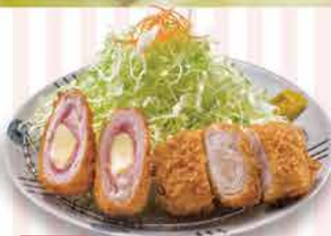
お好きな ミルフィーユと チーズチキンかつ定食 1,480円 (税込1,628円) 茶碗蒸し付 +110円(税込)