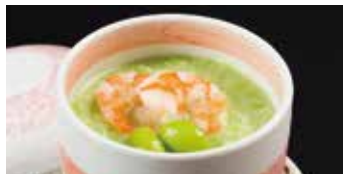
季節の具材が入った茶碗蒸し 定食ご注文の方 100円 (税込110円) 単品ご注文の方 200円 (税込220円)