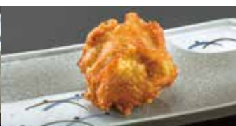
カリッとジューシー! とり唐揚げ 1コ 170円 (税込187円)