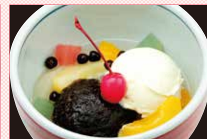
クリームあんみつ 490円 (税込539円)