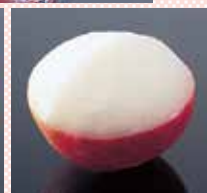
白桃 530円 (税込583円)