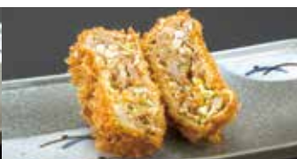
ジュワーッと肉汁が... メンチカツ 1コ 220円 (税込242円)