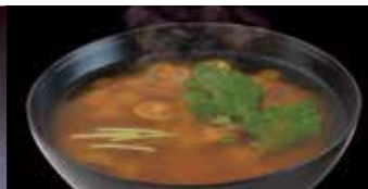
お味噌汁(豚汁またはなめこ) 単品 100円 (税込110円)