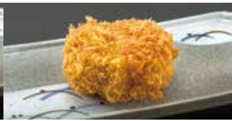
やわらかジューシー! ヒレかつ 1コ 270円 (税込295円)