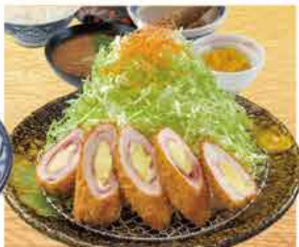
チーズチキンかつ定食 1,280円 (税込1,408円) 茶碗蒸し付+110円(税込)